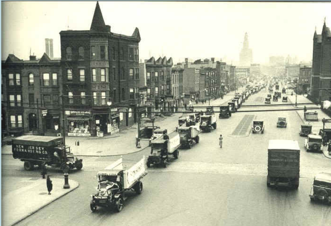
Fourth Avenue, Brooklyn